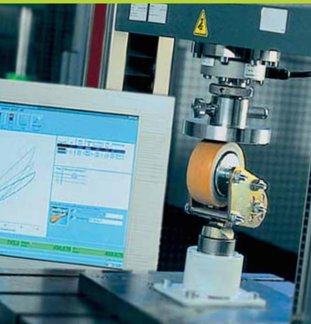
Ensayo de primeras muestras para visto bueno.

Inventar la rueda cada día. Perfeccionar los productos existentes. A variar. A optimizar. Esta es la dedicación y vocación de nuestros numerosos constructores. Las técnicas más modernas como, por ejemplo, los cálculos lineales y no lineales mediante MEF (método de elementos finitos) y la colaboración con institutos de renombre proporcionan a nuestros desarrolladores nuevas ideas que poner en marcha. Meditado y rápido; ya que gracias a la unión entre el departamento de construcción y el propio departamento de construcción de herramientas y a la directa transmisión de datos CAD, es posible implantar las innovaciones con rapidez y sin problemas. El trabajo diario en nuestro departamento de desarrollos no solamente trata de dar soluciones concretas a problemas técnicos, dentro de nuestras tareas también se incluye la investigación básica. El mejor ejemplo: las innovadoras bandas de rodadura de poliuretano Besthane®. Ideal para aplicaciones bajo las condiciones más extremas, cargas pesadas y elevadas velocidades. Desarrollado en nuestro propio laboratorio.