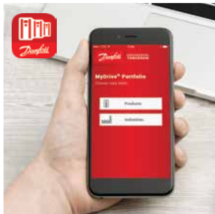
Catálogo de productos MyDrive®