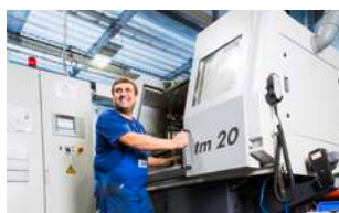
CONSTRUCCIÓN DE MAQUINARIA