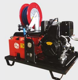
PÁGINA 42 - 43

Hidrolimpiadoras High pressure cleaners Nettoyeurs