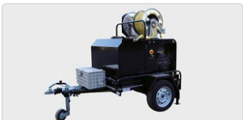
MAXIHOT PÁGINA 40

15 - 25 lts/min | 200 - 300 Bar | 17 - 26,5 CV