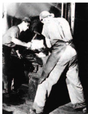
Fragua para la elaboración de cadenas 1956