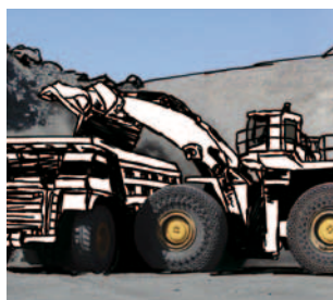
Segmento G Cadenas de protección de neumáticos