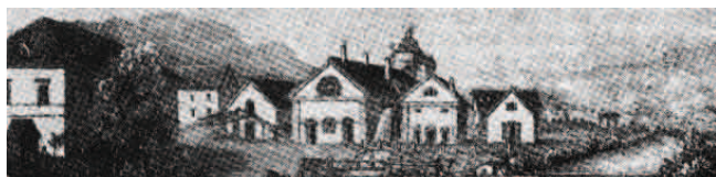
Litografía de la fragua en Brückl 1855