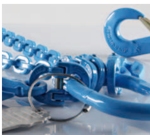
Segmento F Medios de elevación y cadenas de trincaje