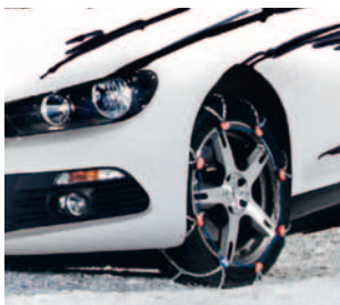
Segmento A Cadenas de nieve y forestales

La paleta de productos se extiende desde cadenas de tracción para neumáticos (cadenas de nieve para coches, camiones y vehículos especiales), cadenas de protección de neumáticos en vehículos para minas, diferentes cadenas industriales, hasta productos hágalo usted mismo (por ej., cadenas ligeras, cinturones, etc.).