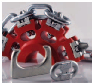
Segmento B Cadenas para sistemas de elevación y transporte