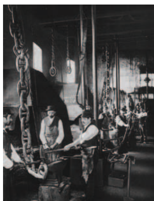
Fragua dedicada a la elaboración de cadenas de ancla 1878