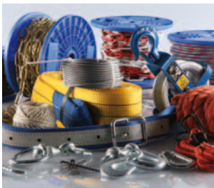
Segmento C Hágalo usted mismo