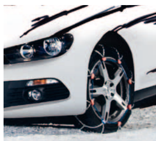
Segmento A Cadenas de nieve y forestales

La paleta de productos se extiende desde cadenas de tracción para neumáticos (cadenas de nieve para coches, camiones y vehículos especiales), cadenas de protección de neumáticos en vehículos para minas, diferentes cadenas industriales, hasta productos hágalo usted mismo (por ej., cadenas ligeras, cinturones, etc.).