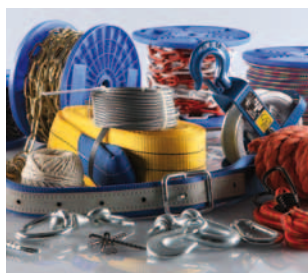
Segmento C Hágalo usted mismo