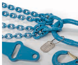
Segmento F Medios de elevación y cadenas de trincaje