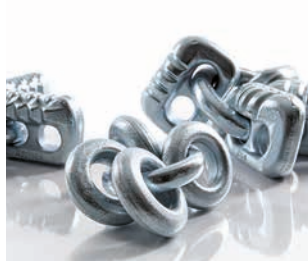
Segmento G Cadenas de protección de neumáticos