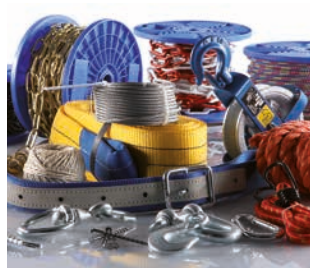
Segmento C Hágalo usted mismo