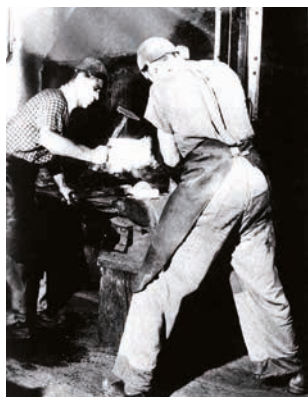
Fragua para la elaboración de cadenas 1956