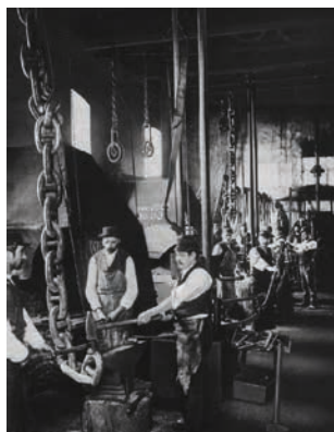
Fragua dedicada a la elaboración de cadenas de ancla 1878