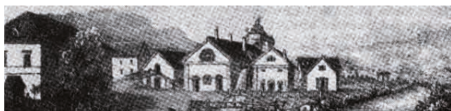
Litografía de la fragua en Brückl 1855