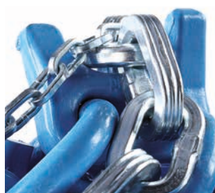
Segmento A Cadenas de nieve y forestales

La paleta de productos se extiende desde cadenas de tracción para neumáticos (cadenas de nieve para coches, camiones y vehículos especiales), cadenas de protección de neumáticos en vehículos para minas, diferentes cadenas industriales, hasta productos hágalos usted mismo (por ej., cadenas ligeras, cinturones, etc.).