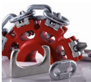
Segmento B Cadenas para sistemas de elevación y transporte