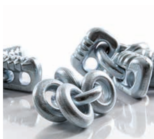
Segmento G Cadenas de protección de neumáticos