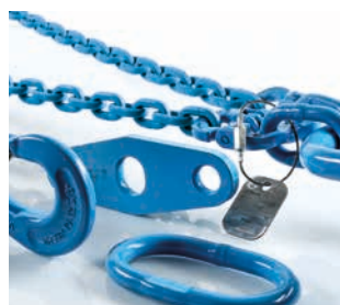
Segmento F Medios de elevación y cadenas de trincaje