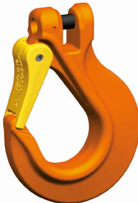
BKHSW Gancho de acoplamiento extragrande

El manual de instrucciones completo anexo aclara las dudas. El acabado según norma EN 1677-2 con valores mecánicos para G10, la autorización de la mutua profesional y el marcado CE son también una garantía de calidad. El juego de repuesto KBSW consta de perno para acoplamiento y pasador de seguridad, el juego de repuesto SFGW-B, de lengüeta de seguridad, un muelle y casquillo de seguridad.