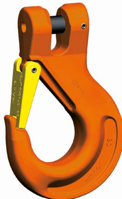
KHSW Gancho con acoplamiento

Tampoco hay ningún inconveniente cuando se necesiten piezas de recambio: los pernos para acoplamiento y los pasadores de seguridad pueden adquirirse como juego de repuesto KBSW. El juego de lengüeta de seguridad está también disponible como recambio SFGW.