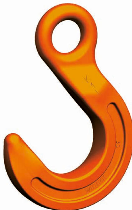
FW Gancho de boca ancha

En general hay que evitar su montaje con eslabones conectores Unilock.