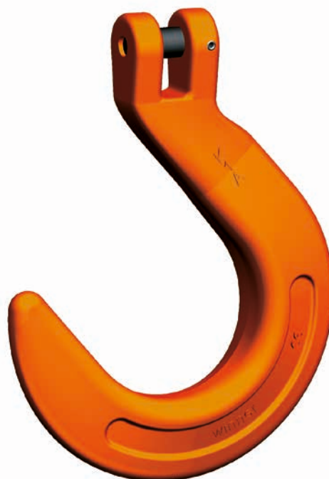
KFW Gancho de boca ancha con acoplamiento

La carga debe aplicarse sólo en tracción recta y hay que evitar cargar la punta del gancho. También hay que aclarar antes de cada uso si es admisible el uso sin lengüeta de seguridad. Una persona experta puede montar el gancho de boca ancha para acoplamiento rápidamente sin herramientas especiales y sabe lo fácil que resulta obtener piezas de recambio para perno de acoplamiento y pasador de seguridad gracias al juego de repuesto.