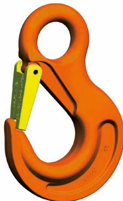
HSW Gancho de ojo

El juego de lengüeta de seguridad SFGW está disponible como juego de repuesto.