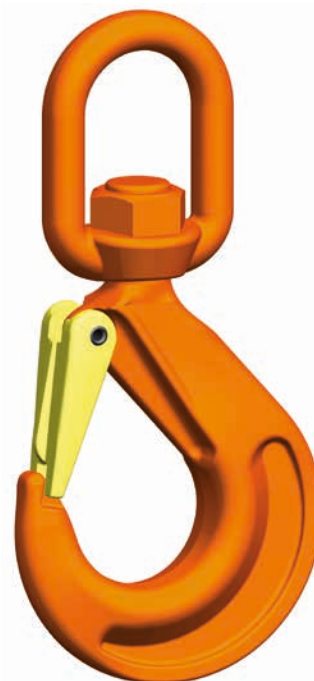
WSBW Gancho giratorio

Es excelente para facilitar procesos de elevación y transporte posibilitando montar un aparejo corto para reducir de un gancho de grúa muy grande a otro pequeño. Un manual de instrucciones completo informa sobre las múltiples posibilidades de uso del gancho giratorio. El juego de lengüeta de seguridad SFGW está disponible como juego de repuesto.