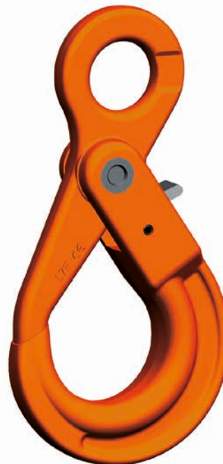
LHW Gancho de seguridad

El juego de mecanismo de cierre VLHW en el dorso del gancho está disponible como juego de repuesto.