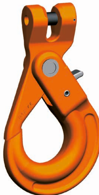
KLHW Gancho de seguridad con acoplamiento

El montaje sencillo sin necesitar herramienta especial ni eslabón conector queda reservado a una persona experta. El manual de instrucciones completo informa sobre el uso correcto. El gancho dispone de autorización de la mutua profesional y de marcado CE y tiene piezas recambiables: el perno para acoplamiento y el pasador de seguridad pueden adquirirse como juego de repuesto KBSW así como el juego de mecanismo de enclavamiento VLHW, como mecanismo de cierre.