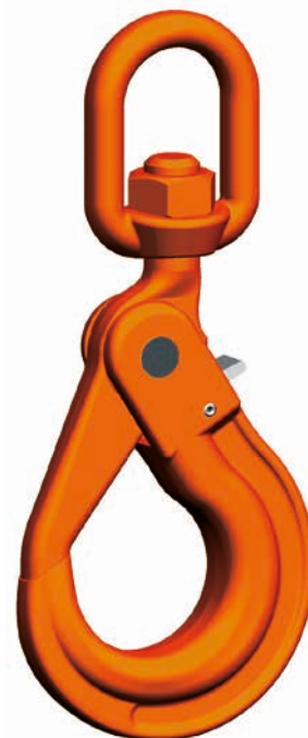
WLHW Gancho de seguridad giratorio

El juego de mecanismo de cierre VLHW en el dorso del gancho está disponible como juego de repuesto.