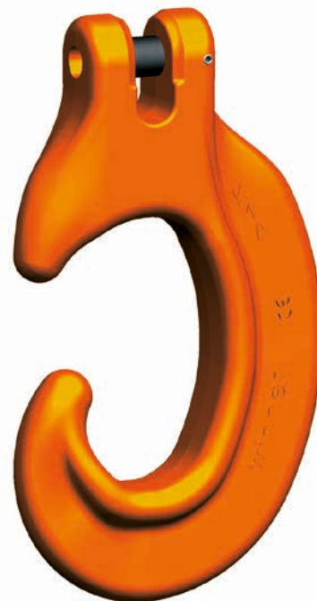
KCHW Gancho en C con acoplamiento

¡El gancho en C para acoplamiento es una excelente solución si se presta atención a usarlo sólo con tracción recta y a no aplicar la carga en la punta!