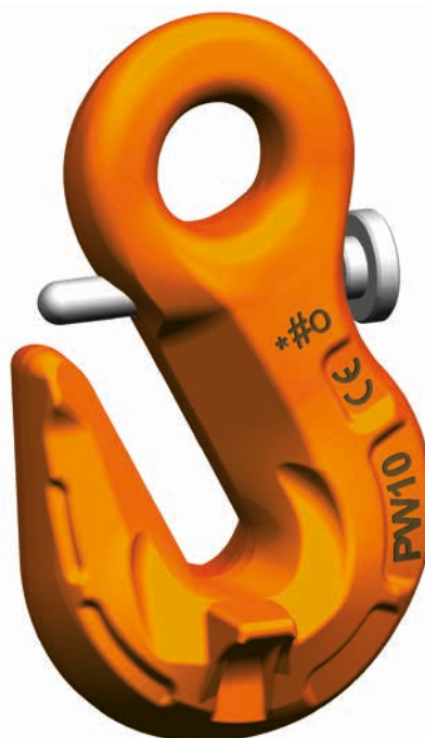
PSW Gancho paralelo con fiador

El juego de fiador de seguridad está disponible como repuesto. El juego de repuesto PSGW está formado por un perno, un muelle y una tuerca.