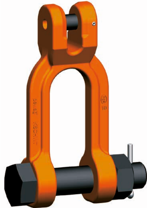
KSCHW Grillete con acoplamiento

Antes de cada proceso de elevación hay que asegurarse de que está montada la grupilla y de que la carga se aplica con tracción recta y no transversal. Hay que encargar el montaje a una persona experta que no necesita herramientas especiales. El juego de repuesto KBSW consta de perno para acoplamiento y casquillo de fijación, el juego de repuesto KBMSW, de tornillo especial, tuerca y grupilla.