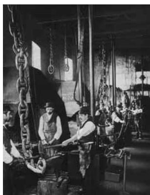
Fragua dedicada a la elaboración de cadenas de ancla 1878