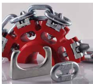
Segmento B Cadenas para sistemas de elevación y transporte