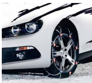
Segmento A Cadenas de nieve y forestales

La paleta de productos se extiende desde cadenas de tracción para neumáticos (cadenas de nieve para coches, camiones y vehículos especiales), cadenas de protección de neumáticos en vehículos para minas, diferentes cadenas industriales, hasta productos hágalo usted mismo (por ej., cadenas ligeras, cinturones, etc.).