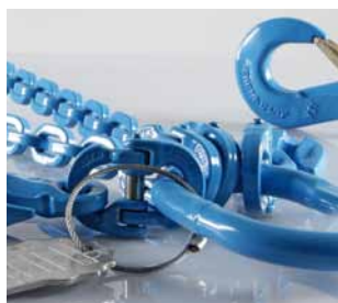
Segmento F Medios de elevación y cadenas de trincaje