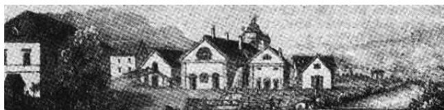
Litografía de la fragua en Brückl 1855