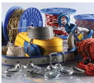
Segmento C Hágalo usted mismo