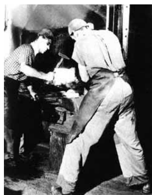
Fragua para la elaboración de cadenas 1956