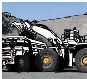
Segmento G Cadenas de protección de neumáticos