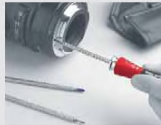
SYSTEM 4: una serie versátil que convence por su flexibilidad y su calidad.

Los juegos están disponibles en compactas bolsas plegables, en resistentes cajas de metal o en cajas de plástico abatibles.