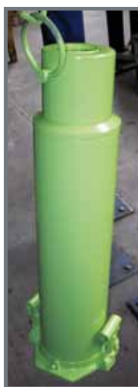
Gato de botella de 2 velocidades de larga carrera. 50 Tn de capacidad.