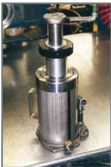
Gato de botella con tuerca de bloqueo.