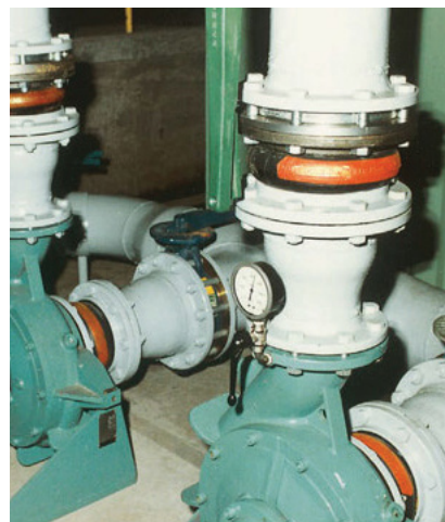
STENFLEX ® Tipo A-1 integrado en bombas